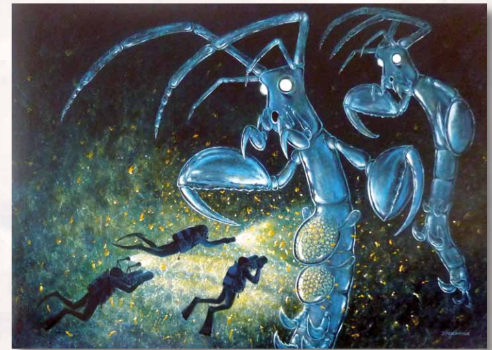
Widderkrebsschen (Caprella sp.), Öl auf Holz, 60 x 80 cm, (2014) Caprelle, peinture à l'huile sur bois Skeleton shrimp (Caprella sp.), oil on wood