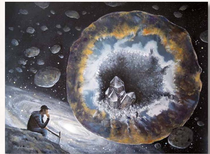
Asteroidenfänger, Öl auf Holz, 60 x 80 cm (2015) 2ter Publikumspreis „Bildungsakademie – Handwerkskammer Stuttgart“; 2016 Captreur d'astéroïdes, peinture à l'huile sur bois Asteroid miner, oil on wood, 2nd Audience Award „Bildungsakademie - HWK Stuttgart“