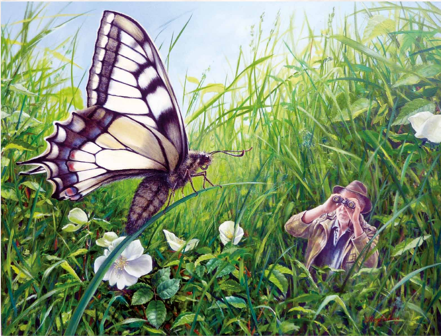
Der Naturforscher, Öl auf Holz, 60 x 80 cm, (2011), 1. Publikumspreis „Förderung der Kunst Stuttgart e.V.“; 2016 Le naturaliste, peinture à l'huile sur bois, 1er Prix du public „Förderung der Kunst Stuttgart e.V.“; 2016 Naturalist, oil on wood, 1st Audience Award "Promotion of Art Stuttgart e.V."; 2016